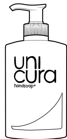
Unicura Balans handzeep